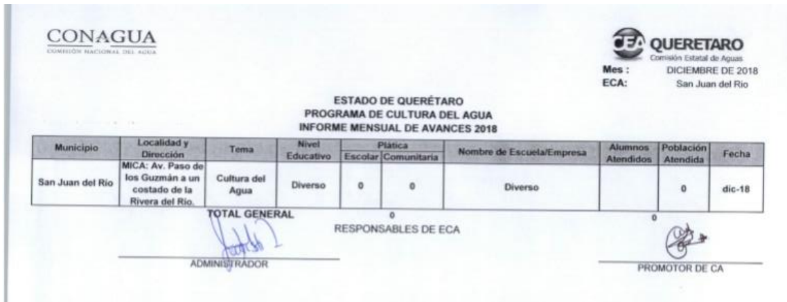
Ilustración 3: REPORTE ECA DICIEMBRE